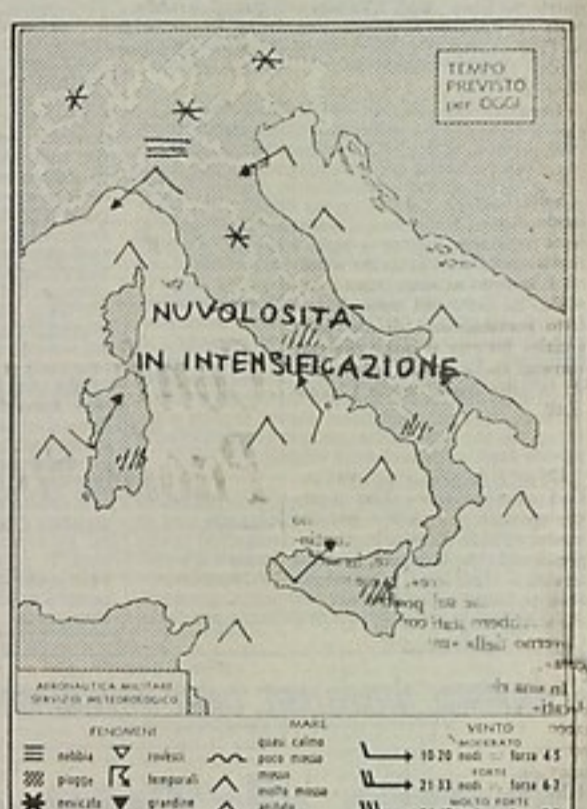
TEMPO PREVISTO per oggi