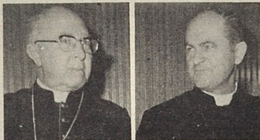
Il cardinale Willebrands e monsignor Tomko

Si tratta di rendere governabile al proprio interno la situazione olandese, e di riportare quest'ultima (che da 15 anni rappresenta la punta più avanzata fra tutte le comunità cattoliche del mondo) nei limiti consentiti dalle direttive ufficiali. Sono in questione: i rapporti dei vescovi