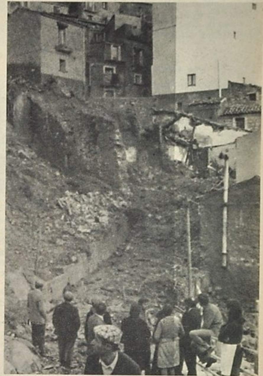
Nicosia sconvolta dalle frane in seguito all'alluvione

Le iniziative delle assemblee e dei governi regionali della Sicilia e della Calabria, dei comuni e dei comitati unitari. Una «vertenza territoriale» che esige il massimo di unità. Lo scontro è essenzialmente politico, e deve passare attraverso una profonda riforma dei partiti nel Mezzogiorno