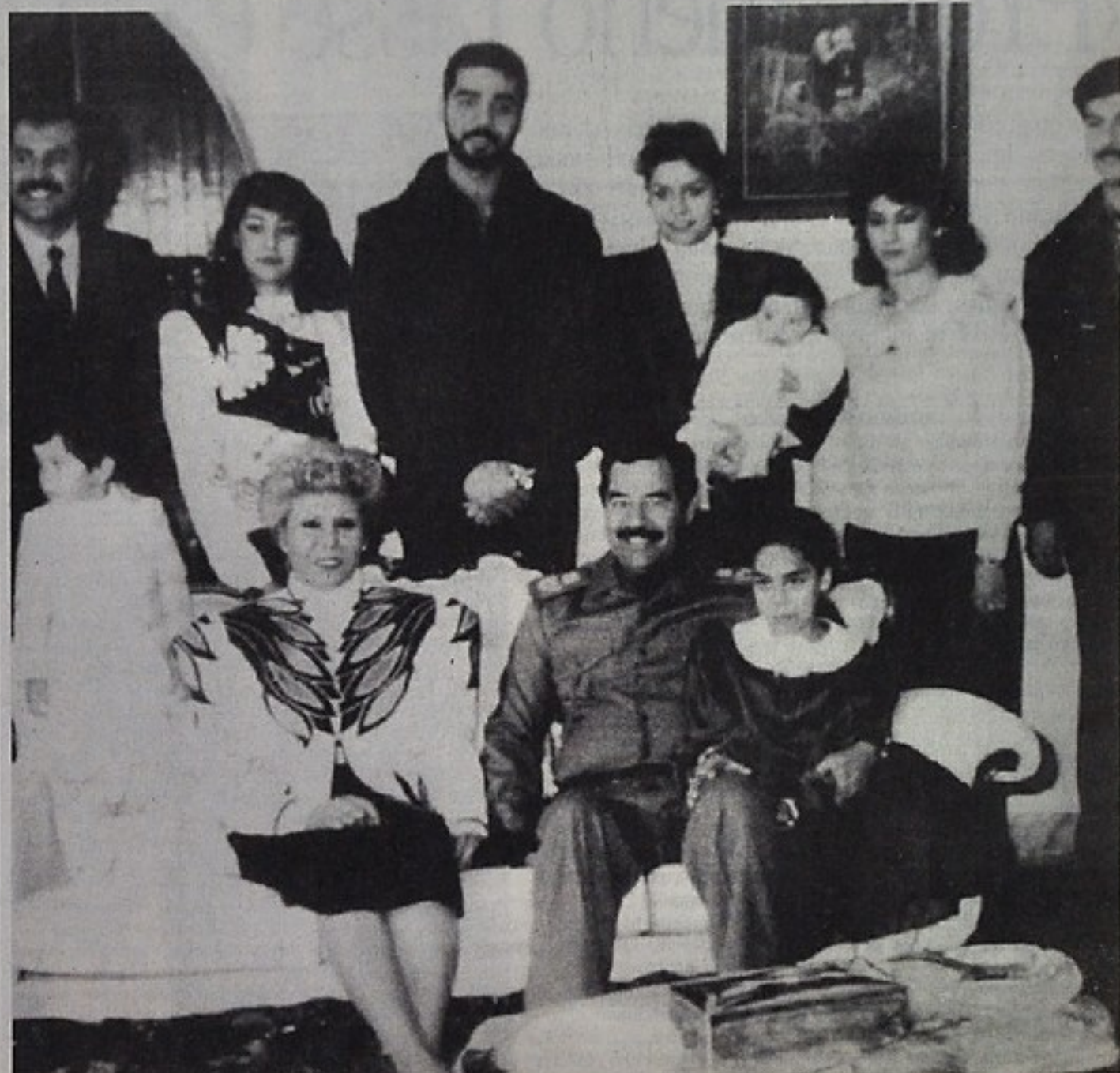
Uday Hussein al centro, in piedi, dietro le spalle del padre Saddam in un foto di famiglia