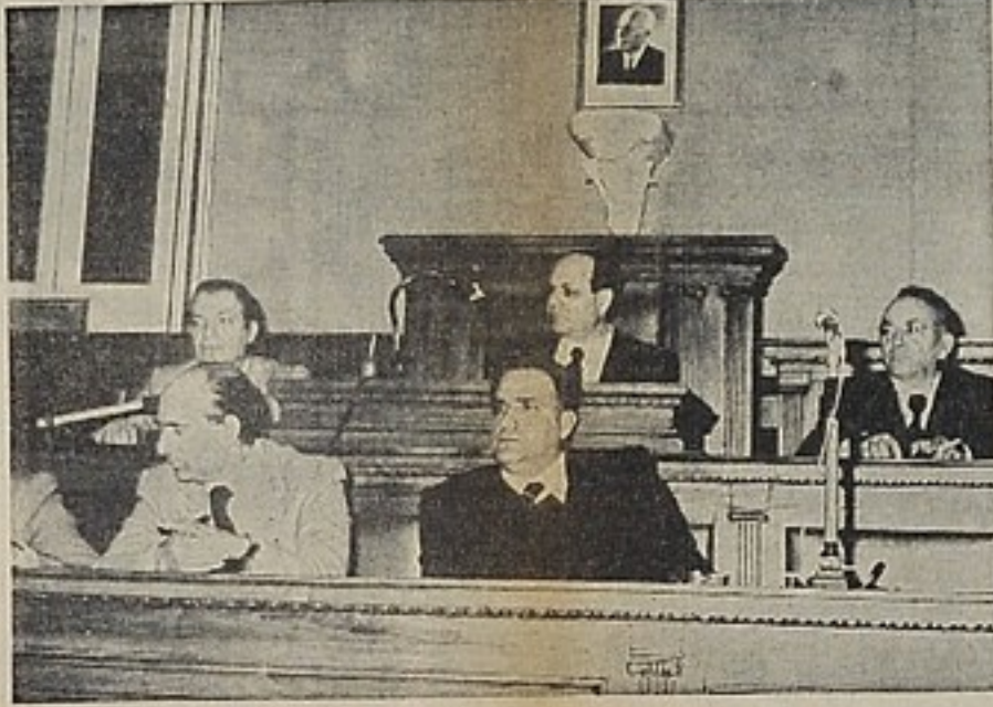
Il presidente della Provincia Sciuto e il sindaco della Giunta, durante la seduta del Consiglio dedicata a Mattarella.

«Quando tutto intorno a noi sembra oscurarsi, ecco la luce della fede, che costituisce, nei momenti terribili, l'unica salvezza per l'uomo. L'uomo da solo a se stesso non basta. Egli ha bisogno di sentire, di avvertire l'impronta di Dio».